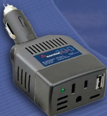
Inversor SAMLEX ONDA MODIFICADA 12V 100W