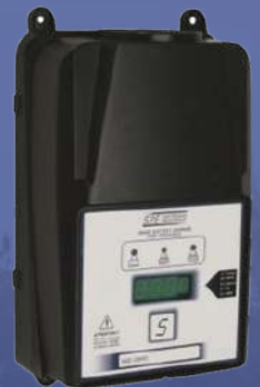
Cargador SPE (Para maquinaria de elevación, montacargas, carritos de golf)