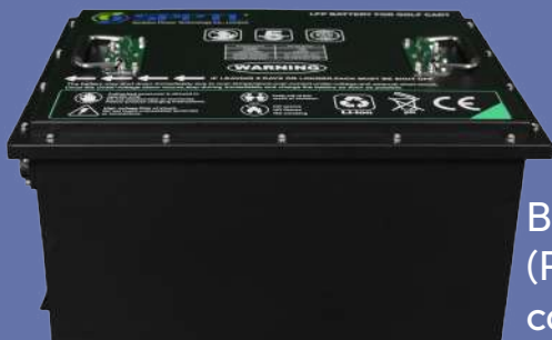
Batería SPPTL (Para uso en carritos de golf)