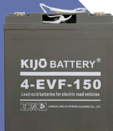
Batería KIJO (Para uso en energía solar)