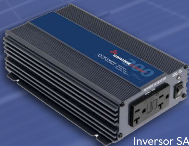
Inversor SAMLEX ONDA PURA 24V 300W