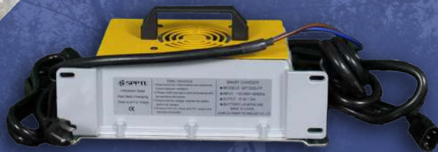
Cargador SPPTL (Para carritos de golf)