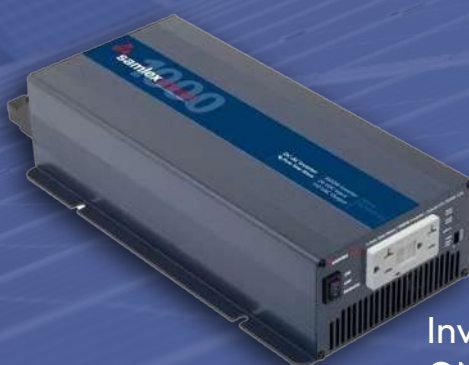
Inversor SAMLEX ONDA PURA 24V 1000W