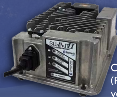
Cargador LESTER (Para carritos de golf, vehículos eléctricos)