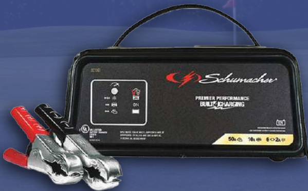
Cargador SCHUMACHER (Para uso automotriz)