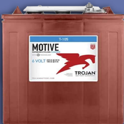
Batería TROJAN T105 (Para uso en carritos de golf, maquinaria de elevación, montacargas)